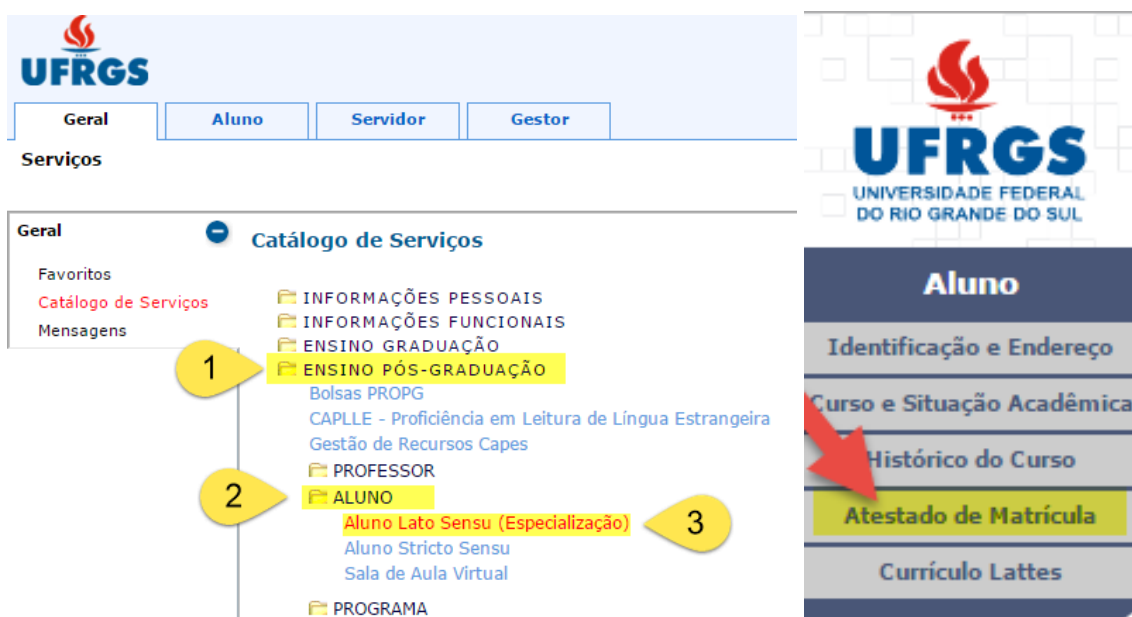
Figura 2. À esquerda o acesso ao Catálogo de Serviços da UFRGS, e à direita as opções disponíveis aos alunos Lato Sensu (Especialização)

Após login no sistema da UFRGS, o(a) aluno(a) acessará o Catálogo de Serviços da UFRGS. Para mais informações sobre o seu vínculo com a Universidade, tais como seus dados de identificação, situação acadêmica, histórico (de conceitos) do curso, e a emissão de atestado de matrícula, escolha (1) “Ensino Pós-Graduação” > (2) “Aluno” > (3) “Aluno Lato Sensu (Especialização)”